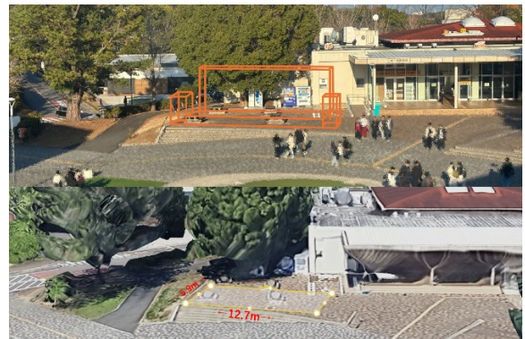
設置イメージ